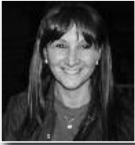
Por Claudia Valerga